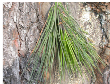
(a) Muestra de follaje de Pinus patula .