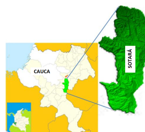
(b) Sitio de muestreo: Sotará, Cauca, Colombia.