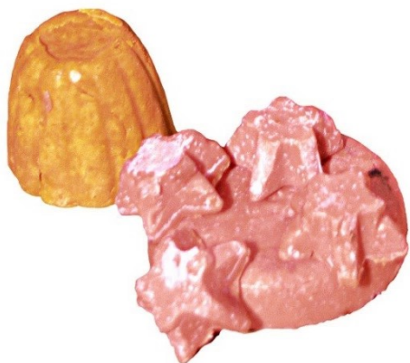
Figura 3. Barras de jabón obtenidas en este trabajo.

3 se muestra el producto obtenido con el proceso de producción seleccionado.